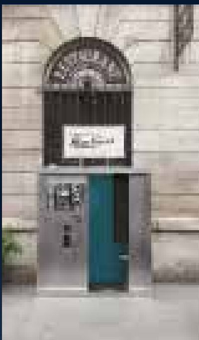
Luminia dans son chalet

• 17 h 30 : animation de l'association O'Vive la Vie, portail sud.