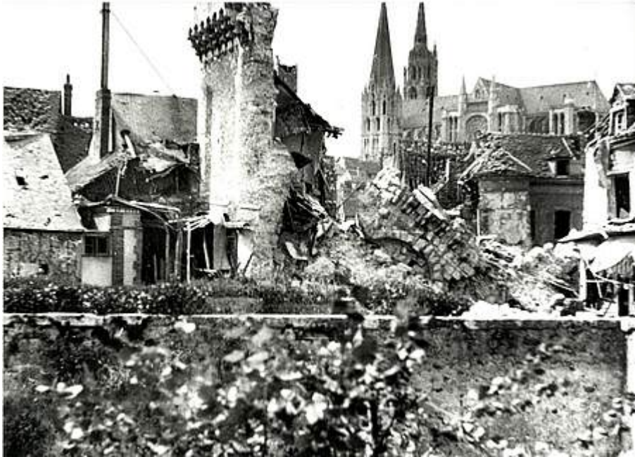
La porte Guillaume. (Archives municipales)

La mutation conduisant à la ville d'aujourd'hui ne s'opère qu'au milieu du XXe siècle après que la ville eut effacé les plaies des deux guerres mondiales. La ville subit son premier bombardement le 15 août 1918, avant de connaître ceux de juin 1940 et de mai 1944. Le 17 juin 1940, le préfet Jean Moulin s'oppose courageusement aux exigences de l'occupant, devenant ainsi le premier résistant de France. En 1944, avant d'être libérée par le 20e corps U.S. et les patriotes locaux, la ville subit de nombreuses atteintes qui causent, entre autres, la perte de la Porte Guillaume et de sa bibliothèque, l'une des plus riches de France.